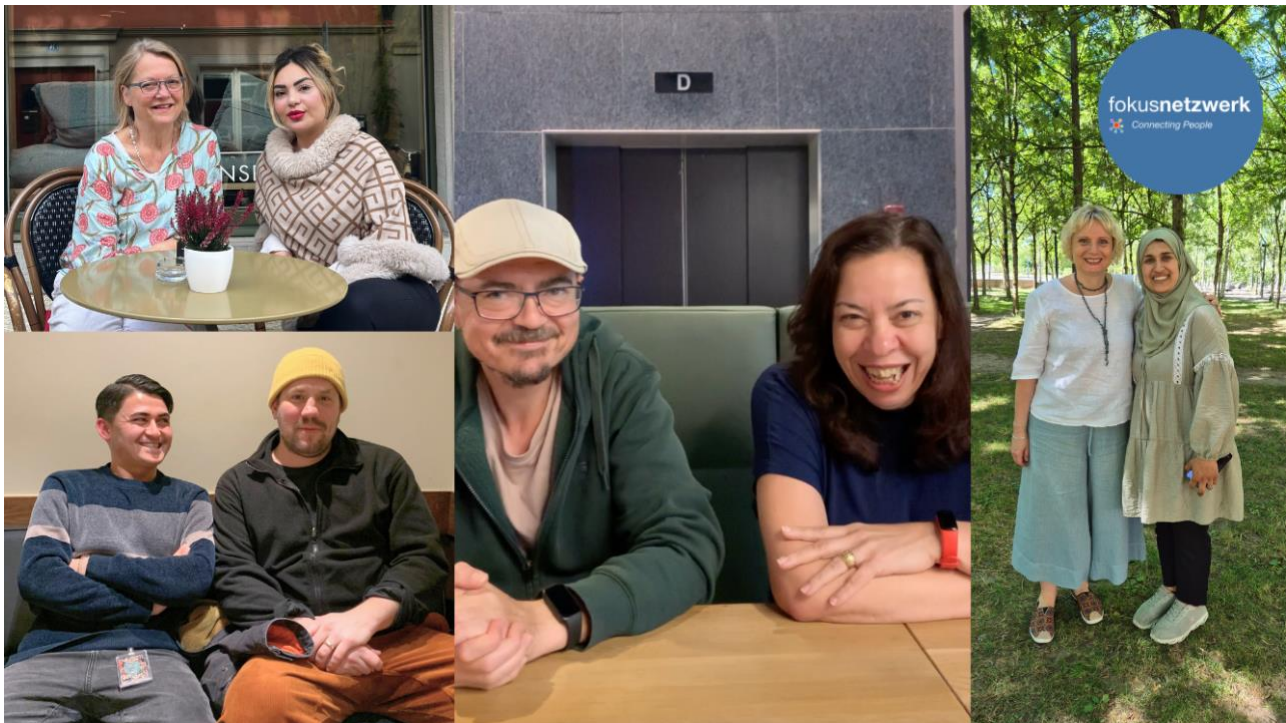
Abb. 1: Einige fokusnetzwerk Tandems im Jahr 2025

Das Tandemprogramm fokusnetzwerk bringt geflüchtete Menschen und Freiwillige aus der Bevölkerung zusammen – regional, thematisch und basierend auf gemeinsamen Interessen. prointegration ist seit 2021 Partner der Fachstelle Integration des Kantons Zürich und Teil des kantonalen Tandemprogramms.