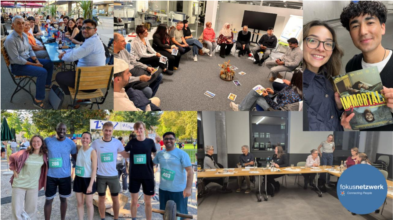
Abb. 2: Von links oben nach rechts unten: fokusnetzwerk Rundi, Erfahrungsaustausch für Geflüchtete mit Femmes-Tische und Männer-Tische, Immortals Film-Vorpremiere mit Tandem von fokusnetzwerk, Team fokusnetzwerk am Lauf gegen Rassismus am 21.09.2025, Weiterbildung «Leichte Sprache» am 2.10.2025 im Zollhaus in Zürich