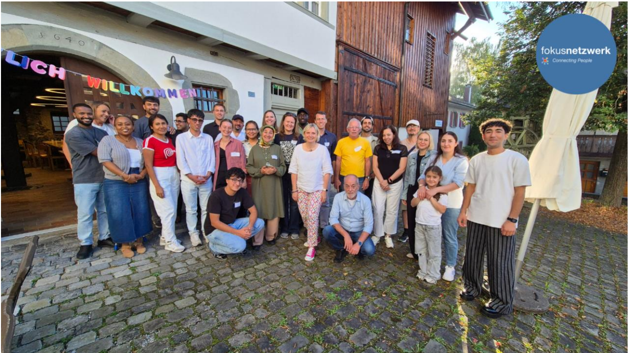
Abb. 3: Sommerfest am 19. September 2025 vor dem Dorf-Träff in Opfikon

Dank der Unterstützung unserer Partner und der engagierten Freiwilligen konnten wir auch in diesem Jahr zahlreiche Brücken bauen und die gesellschaftliche Integration von Menschen mit einer Fluchtbiografie aktiv fördern.